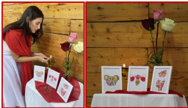
Altar Presentación Danza Ritual Tesis LVDU® Abril 2025

Desde este lugar de conciencia, me dispongo a seguir caminando con mayor liviandad, confiando en la inteligencia de mi cuerpo y en la guía profunda del sagrado femenino que habita en mí. Cierro este ciclo agradeciendo cada experiencia vivida, sabiendo que todo lo transitado fue necesario para parirme desde el alma y abrirme a una vida más plena, consciente y en coherencia.