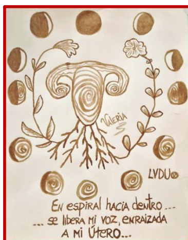
Arte menstrual — Luna Llena. Junio, 2025.

Ahora sé que mi viaje continúa: seguiré pariendo vida, proyectos y conciencia desde mi cuerpo, desde mi pelvis, desde mi útero y desde mi voz.