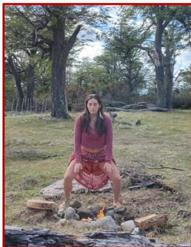
Práctica LVDU® con el elemento Fuego. Octubre, 2024.

Como describe Jeannine Parvati Baker: “Dar a luz conscientemente es abrimos a las fuerzas de la creación que nos atraviesan; es dejar que el misterio actúe a través de nosotras”.